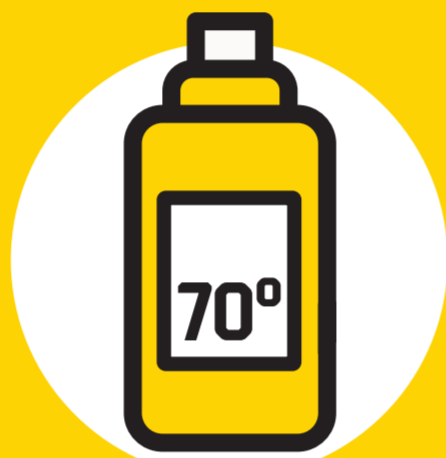
Produtos que contenham pelo menos 70% de álcool