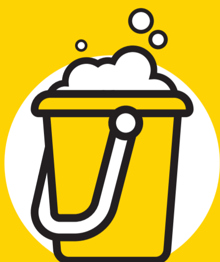
Água e sabão