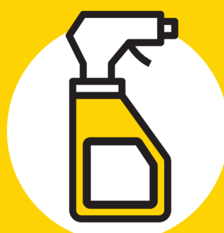
Produtos específicos para a desinfeção do interior do veículo