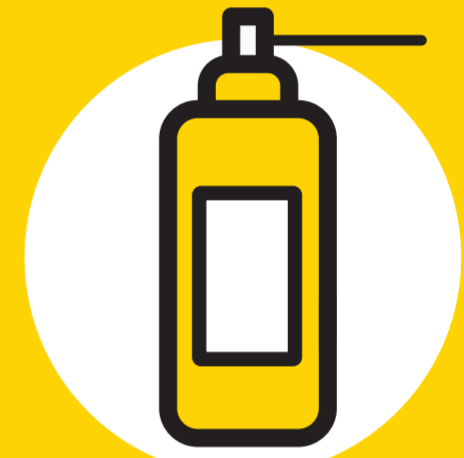
Sprays desinfetantes específicos para o ar condicionado (Deverá arejar o habitáculo depois da sua utilização)