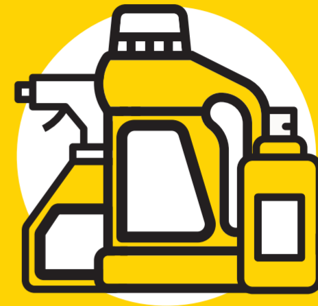
Produtos de desinfeção