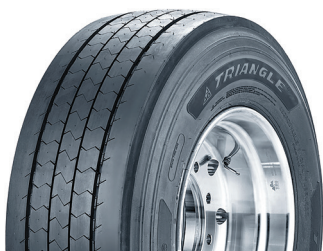
OVATION / TRIANGLE / UNIROYAL

4 Fruto das excelentes parcerias que temos com os nossos fornecedores, tanto na Semperit como na Goodride, temos logrado estar numa evolução do nível de vendas, tendo sido a S. José Pneus um garante do abastecimento ao mercado, em todas as gamas. O mercado de pneus pesados tem evoluído favoravelmente, sendo um setor que se manteve sempre estável, mesmo durante a pandemia, dada a necessidade de transportes para continuar a assegurar a logística das necessidades básicas da população.