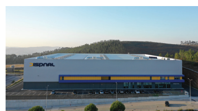
PETLAS / TRAZANO / ANTEO DispnaL Soraia Rocha www.dispnaL.pt